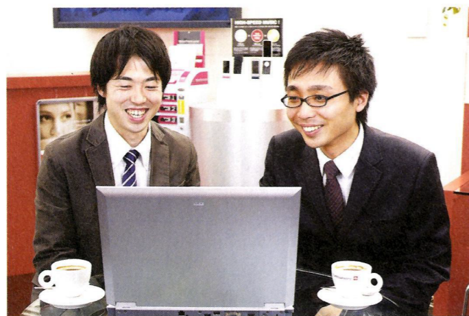
パソコンを前にSNSについて話し合う2人(場所: NEC Uギャラリー)